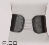
P.30 アジャスタブル バック アンド アブドミナル サポート