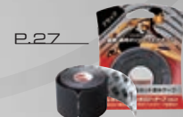
P.27 プレカット・ キネシオロジーテープ BK