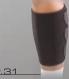
P.31 カーフ&シンスプリント サポート