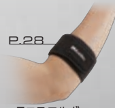
P.28 テニスエルボー サポートウイズ ジェルパッド