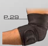
P.29 アジャスタブル エルボーサポート