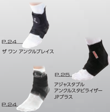
P.24 ザワン アングルブレイス