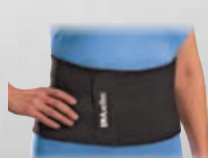
P.30 ウエストサポート