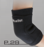
P.29 エルボーサポート