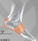
P.27 PF TAPE® 足底筋膜サポートテープ