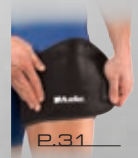
P.31 アジャスタブル サイグロイン サポート