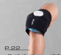
P.22 ・アイスバッグ リューザブル ・アイスバッグ ラップ