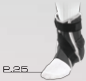
P.25 Hg80® プレミアム・ハードシェル アングルブレイス