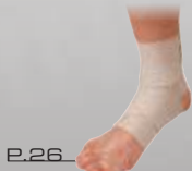
P.26 ワンダーラップ アングル