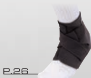
P.26 アジャスタブル アングルサポート JPプラス