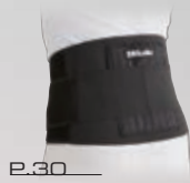
P.30 アジャスタブル バックブレイス